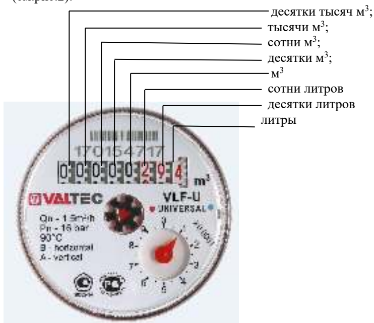
Рисунок 2. Табло счетчика

6.1. Показания прибора считываются в прямоугольных окошках табло (см.рис.2):